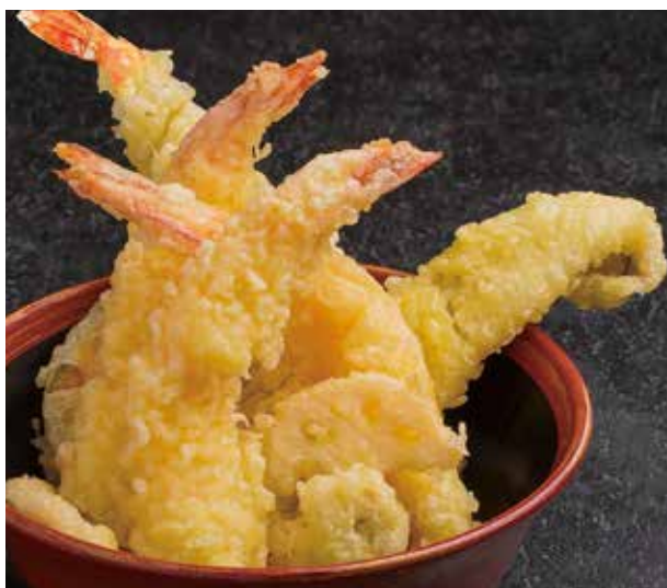
特大海老と穴子天丼

[ライスは 大/中/小 より選べます] You can decide whether you want a small, medium, or large serving of rice.