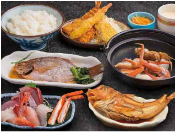
魚がしスペシャル定食 ／漁師のめった汁付き ¥1,850

[ライスは 大/中/小 より選べます] You can decide whether you want a small, medium, or large serving of rice.