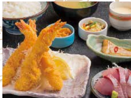
お魚と大海老フライ定食 ¥1,700