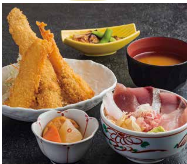
海鮮丼と海鮮フライ盛り

Assorted Seafood Rice Bowl & Assorted fried Seafood