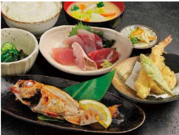
お刺身と のど黒塩焼き定食 ¥3,000