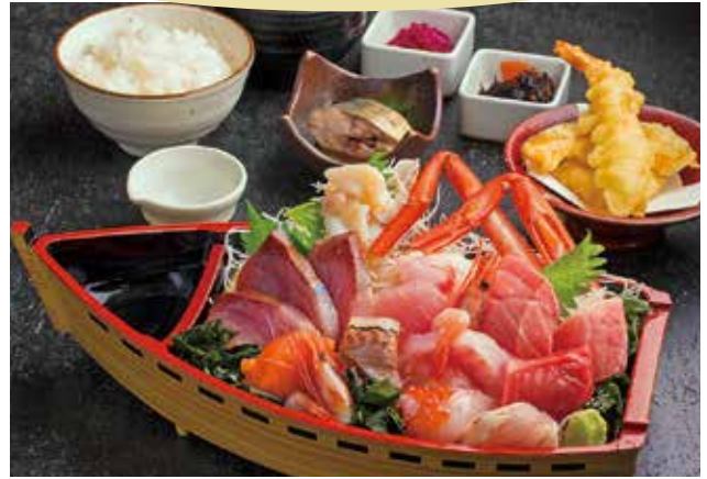
魚がし大漁お刺身定食 ¥2,500 旬のオススメ刺身が大漁。