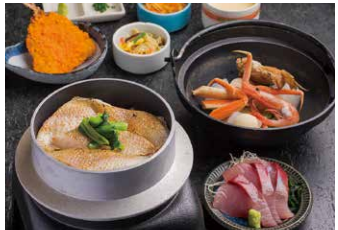
丸ごと一匹のど黒釜飯セット ¥2,800 のど黒(半身)釜飯セット ¥1,800