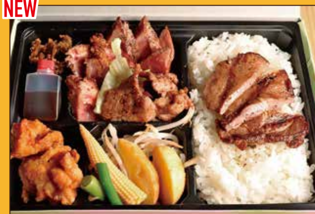
NEW G-7 お肉大好き弁当 (牛タン、サーロイン、牛バラ) 1,200円