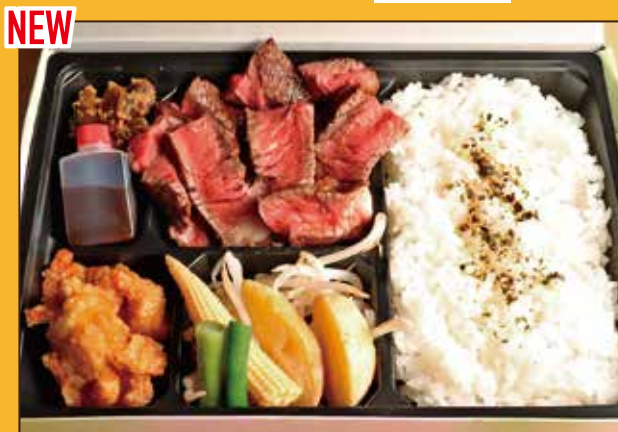
NEW G-6 牛ランプステーキ 150g 弁当 1,000円