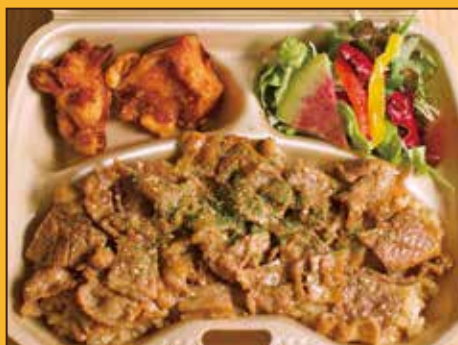
G-4 牛バラ蒲焼き風 弁当 850円