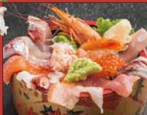
海鮮上ちらし 1,500 円