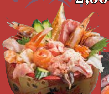
海鮮特上ちらし 2,200 円