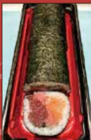
具沢山中巻き 1,200 円