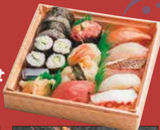
お寿司 盛り合わせ 1,300 円