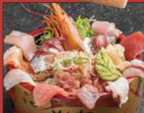
海鮮ちらし 1,200 円