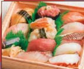
にぎり 12 貫 1,500 円