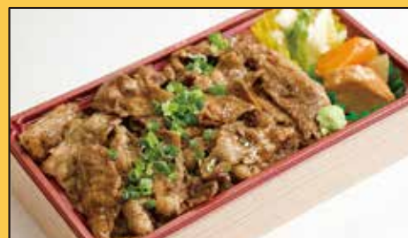
牛バラ鉄板焼き重 900円