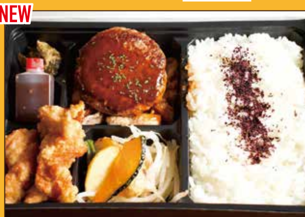
NEW G-8 自家製牛たん ハンバーグ弁当 1,000円