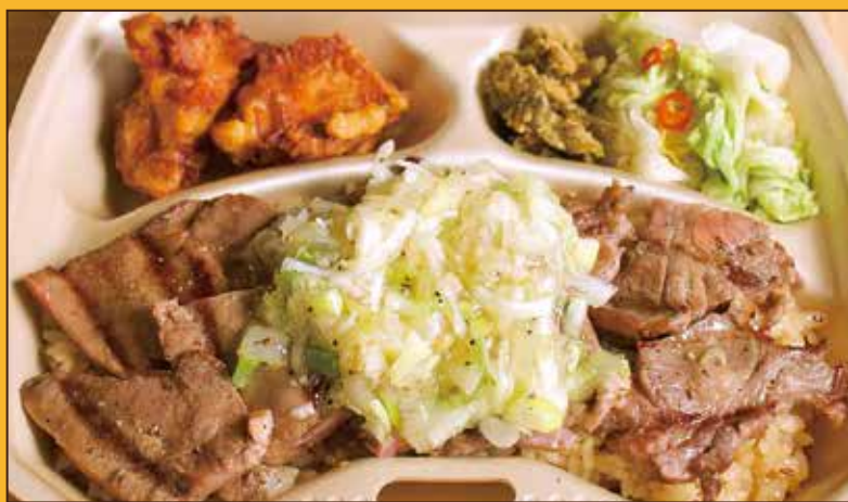
G-3 ネギ塩牛たん弁当 1,200円