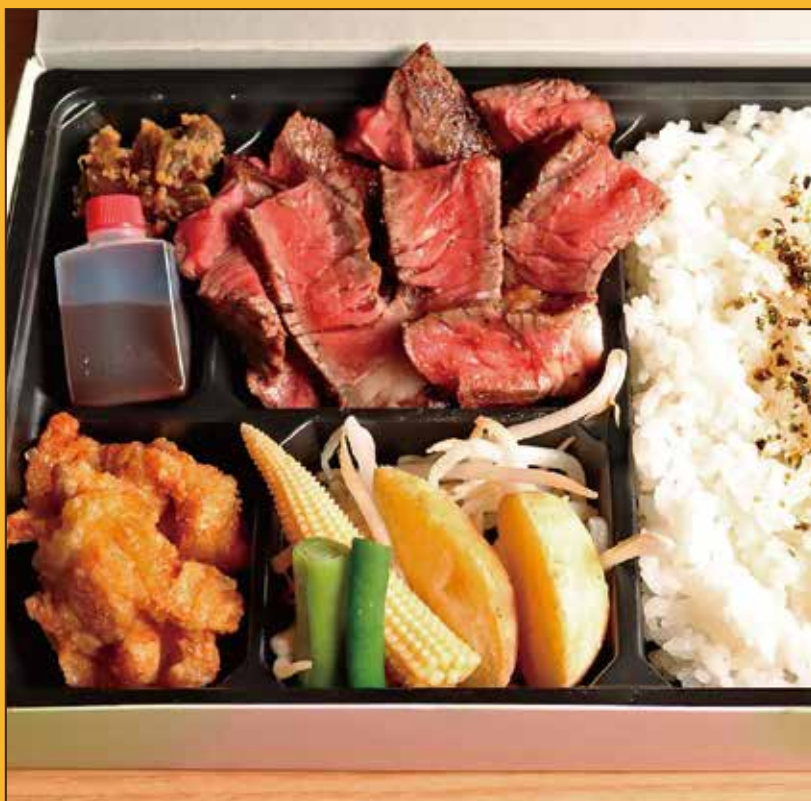
G-6 牛ランプステーキ 150g 弁当 1,000円