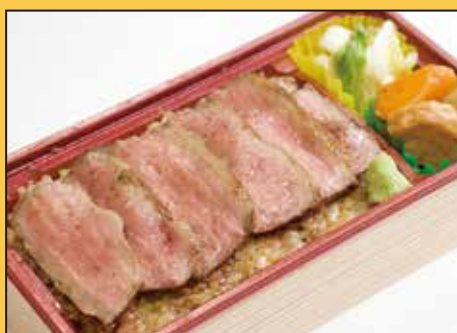
特上タンステーキ重 2,700円