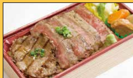
サーロインステーキと ネギ塩牛タン重 1,400円