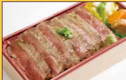
能登牛ステーキ 80g 重 1,500円 能登牛ステーキ 160g 重 2,500円